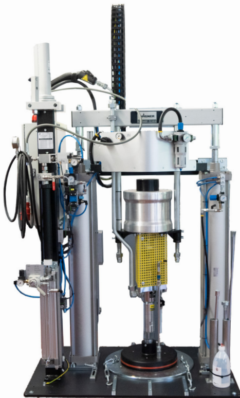
Viscostar 200 Plus

Anlagen und Zubehör Plants & Accessoires