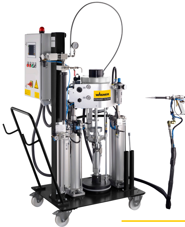
Viscostar 20 Plus